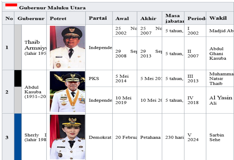
Tabel 1 Daftar Gubernur Maluku Utara

Sumber: Daftar Gubernur Maluku Utara -Wikipedia Indonesia