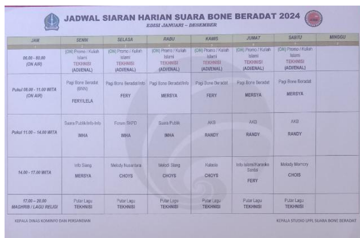
Gambar 1.2 Jadwal Siaran Radio Suara Bone Beradat

Radio Suara Bone Beradat memiliki peran unik sebagai radio lokal yang menyajikan berbagai program seperti Pagi Bone Beradat, Suara Publik, Info Siang, Forum SKPD, Melodi Nusantara, Melodi Siang, Aga Kareba Bone (AKB), Kumpulan Lagu Asia (Kulasia), Info Islami, Karaoke Santai dan Melodi Memori.