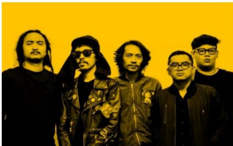
Gambar 1. Personil FSTVLST

Musik kerap kali tidak hanya menjadi medium hiburan, tetapi juga wadah refleksi sosial dan ekspresi ideologis. FSTVLST sebagai band indie asal Yogyakarta menampilkan bentuk kritik sosial yang tajam dan puitis dalam album Hits Kitsch . Salah satu lirik dalam lagu “Orang-Orang di Kerumunan” menegaskan hal ini: “Tak setuju maka beda kubu, tak sepaham lantas baku hantam, yang seiman saling menerakakan.” Penggalan tersebut mencerminkan realitas sosial masyarakat kontemporer yang terjebak dalam fanatisme identitas dan kehilangan empati. Sementara dalam lagu “Hujan Mata Pisau”, FSTVLST menulis: “Seribuan mata pisau terhujan, ketakutanlah yang menenggelamkan.” Lirik ini menjadi metafora atas kekerasan simbolik di era post-truth , ketika informasi disebarakan untuk menakut-nakuti, bukan untuk mencerdaskan. Melalui pilihan diksi yang kuat dan simbolik, FSTVLST berhasil mengubah karya musik menjadi refleksi kritis atas kondisi sosial manusia modern.