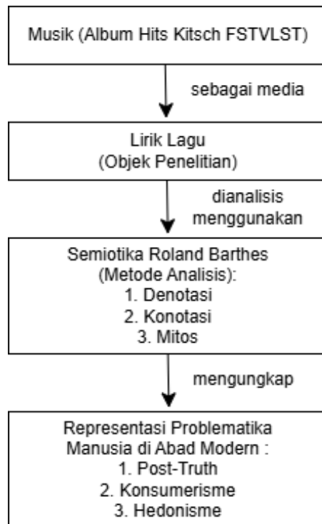
Gambar 2. Kerangka Konseptual