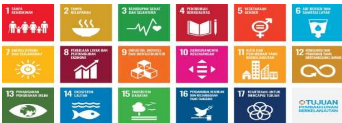
Gambar 1 Tujuan pembangunan berkelanjutan

Namun, keberhasilan implementasi SDGs tidak hanya bergantung pada ketersediaan program dan anggaran, tetapi juga sangat ditentukan oleh akuntabilitas dan responsivitas pemerintah daerah. Akuntabilitas mencerminkan sejauh mana pemerintah daerah dapat mempertanggungjawabkan kebijakan, program, dan penggunaan sumber daya kepada publik. Sedangkan responsivitas mencerminkan kemampuan pemerintah merespon kebutuhan, aspirasi, dan dinamika sosial masyarakat secara cepat dan tepat.