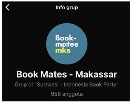
Gambar 2.1 Info Jumlah Anggota Grup WhatsApp Makassar Book Party Jumlah ini dilihat pada bulan Januari 2025.

Populasi dalam penelitian ini adalah seluruh anggota grup whatsapp komunitas Makassar book party yang berjumlah 958 anggota. Populasi ini mencakup individu yang tergabung dalam komunitas melalui platform media sosial seperti Instagram, whatsapp serta mereka yang berpartisipasi dalam kegiatan komunitas.