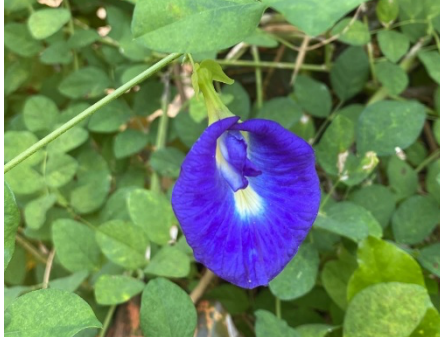
Gambar 2. Bunga Telang ( Clitoria Ternatea L. )