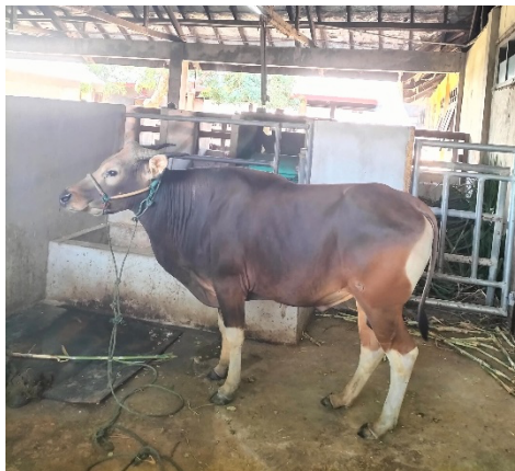
Gambar 1. Sapi Bali

Sapi Bali ( Bos sondaicus ) merupakan sapi asli Indonesia yang populasinya cukup besar dengan wilayah penyebaran yang luas. Sapi Bali memiliki keunggulan dibandingkan sapi lainnya karena mempunyai angka pertumbuhan yang cepat, adaptasi lingkungan yang baik, dan penampilan reproduksi yang baik. Sapi Bali merupakan jenis yang paling banyak dipelihara pada peternakan kecil karena fertilitasnya baik dan angka kematian yang rendah (Purwantara, 2012).