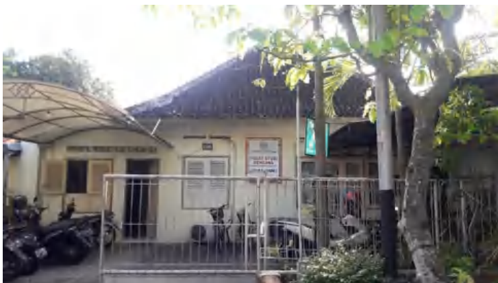
Gambar 2 Pusat Studi Bencana Alam (PSBA) UGM

Pusat studi bencana UGM berdiri secara resmi pada 12 juli 1995. Pusat studi bencana UGM merupakan salah satu pusat studi lingkungan Universitas Gadjah Mada yang bergerak di bidang kajian bencana yang berbasis pada multidisiplin ilmu pengetahuan yang dikembangkan untuk menyumbangkan ide, pendapat dan gagasan terkait manajemen kebencanaan untuk mendukung berbagai kegiatan pendidikan dan pengabdian pada masyarakat. Adapun fasilitas yang ada pada pusat studi bencana UGM yaitu: