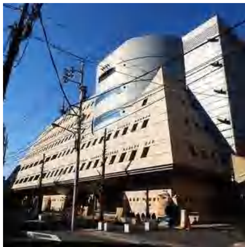
Gambar 3 Honjo Bosaikan Life Safety Learning Center

Honjo Bosaikan Life Safety Learning Center yang terletak di Tokyo-Jepang merupakan tempat edukasi simulasi beberapa bencana alam. Disana dapat merasakan bagaimana jika terjadi bencana alam.