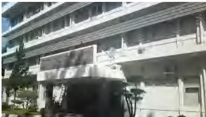
Gambar 4 Pusat Vulkanologi dan Mitigasi Bencana Geologi (PVMBG)

Pusat Vulkanologi dan Mitigasi Bencana Geologi (PVMBG) adalah lembaga di bawah Badan Geologi, Kementerian Energi dan Sumber Daya Mineral (ESDM) Republik Indonesia. Pusat Vulkanologi dan Mitigasi Bencana Geologi (PVMBG) berperan penting dalam mendukung kesiapsiagaan dan mitigasi risiko bencana geologi di Indonesia, negara yang terletak di Cincin Api Pasifik dengan potensi geologi yang sangat aktif. Sebagai salah satu unit utama di bawah Badan Geologi, PVMBG bertanggung jawab untuk mengembangkan sistem peringatan dini, menyusun peta rawan bencana, dan memberikan rekomendasi teknis kepada pemerintah, masyarakat, serta pemangku kepentingan lainnya. Dalam menjalankan tugasnya, PVMBG memanfaatkan teknologi modern, seperti pemantauan seismik, penginderaan jauh, dan analisis gas vulkanik untuk memantau aktivitas gunung api secara real-time. Selain itu, lembaga ini juga terlibat dalam edukasi publik dan pelatihan mitigasi untuk meningkatkan kesadaran masyarakat terhadap ancaman bencana geologi. Kolaborasi dengan lembaga internasional dan nasional memperkuat posisi PVMBG sebagai pusat unggulan dalam manajemen risiko geologi di kawasan Asia Tenggara. Adapun fasilitas yang ada pada Pusat Vulkanologi dan Mitigasi Bencana Geologi yaitu: