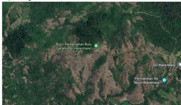
Gambar 1 Kawasan Bulu Garancing

Tidak sekadar menawarkan keindahan, Desa Jangan-Jangan memiliki potensi besar sebagai desa wisata alam. Tanahnya yang subur membuat buah nenas dan kacang tanah jadi andalan di desa ini. Selain menikmati pesona gunung juga bisa mampir di air terjun mare-mare yang letaknya persis di lembah gunung Bulu Garancing tak jauh dari pemukiman warga. Bila ke sana, tersedia pula madu hutan dan gula merah yang bisa dibawa pulang.