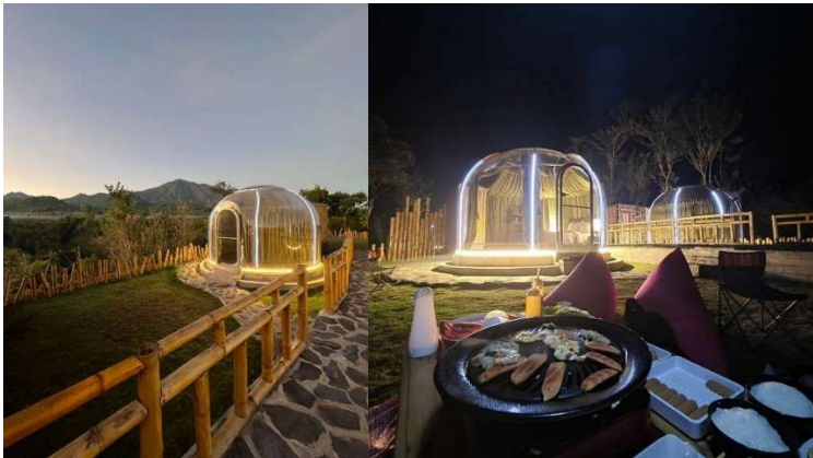
Gambar 3 Glamping Transparan Maron Villy

Saat malam hari, lampu-lampu lampion kawasan taman menyala sungguh indah. Pemandangan ini semakin cantik dengan gemerlap kota Batu dari atas bukit. Hingga waktu sebelum tidur, kamu akan menikmati hamparan bintang bertebaran dilangit malam yang bebaslangsung diatas ranjang tidur. Suasana malam hari pastinya semakin terasa romantis.