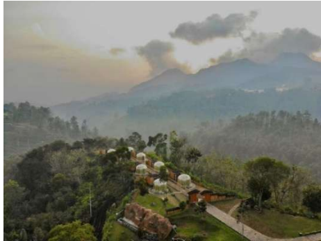
Gambar 2 Kawasan Maron Valley Pujon

Kecamatan Pujon Kabupaten Malang. Aksesnya sangat mudah, sudah ada papan petunjuk arah menuju wisata ini.