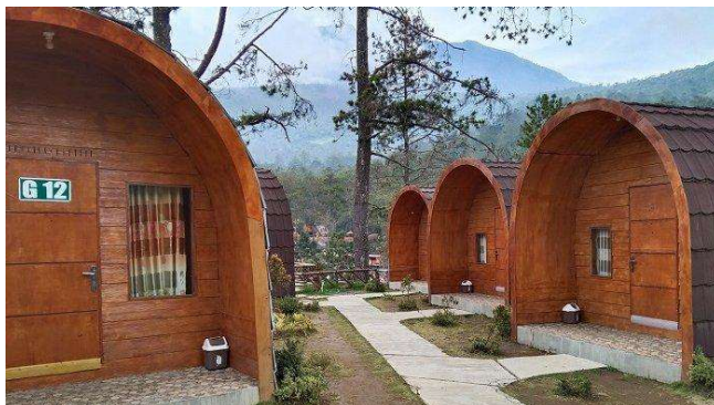
Gambar 7 Glamping hobbit The Lawu Park

The Lawu Park berada di Gondosuli Kidul, Desa Gondosuli, Kecamatan Tawangmangu, Kabupaten Karanganyar, Jawa Tengah. Di dalamnya ada wahana permainan, resort penginapan dan restoran yang menyajikan aneka ragam menu. Bahkan bentuk dari penginapannya cukup unik karena desain setengah lingkaran mirip rumah Hobbit dalam buku karangan J.R.R Tolkien yang kemudian difilmkan.