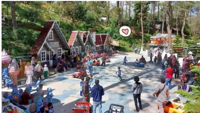
Gambar 9 Area Outbond The Lawu Park

Menawarkan konsep taman wisata, resort dan resto. The Lawu Park didukung pesona panorama alam gunung Lawu, hutan pinus, perbukitan dan wahana wisata kekininian. Ada nuansa salju di tengah hutan, rumah pohon, glamping, jembatan jala tunda, dan masih banyak lagi.