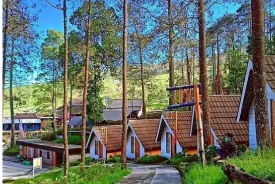
Gambar 8 Glamping The Lawu Park

Selanjutnya terdapat Glamping di sepanjang tepi gunung yang didesain dengan model arsitektur tropis. Fasilitas Glamping yang ditawarkan adalah TV, air hangat, double bed dan gratis tiket masuk ke Lawu Park. Untuk ukuran tempat glamping sendiri adalah 4 x 6 meter dengan bentuk bangunan yang menyerupai segitiga.