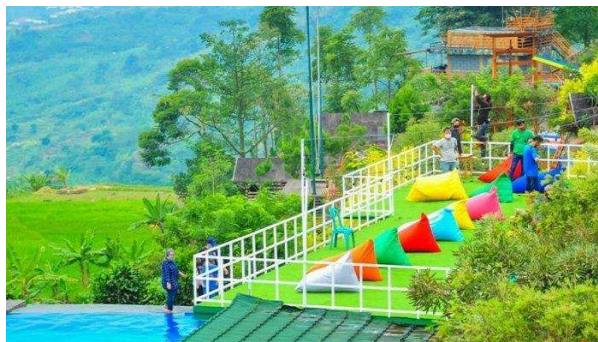
Gambar 4 Teras Sebagai Spot Foto

Tempat wisata ini terletak di Jalan Puncak 2, Desa Wargajaya, Kecamatan Sukamakmur, Kabupaten Bogor, Indonesia. Villa Khayangan Bogor memiliki banyak hal menarik untuk dilihat selain penginapan. Dalam Villa Khayangan Bogor, ada banyak tempat yang cocok untuk foto yang membuat feed Instagram Anda lebih cantik.