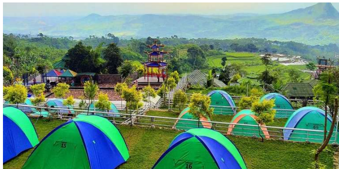
Gambar 5 Area Camping Ground

Selanjutnya, bagi mereka yang ingin lebih dekat dengan alam, terdapat pilihan tenda untuk berkemah. Mulai dari tenda standar hingga tenda dengan gaya suku Amerika Selatan, semuanya tersedia di sini. Fasilitas yang disediakan lengkap seperti pada villa, termasuk kulkas dan akses jaringan wifi. Pilihan ini memberikan pengalaman berkemah yang seru bagi anak-anak tanpa harus repot membawa perlengkapan sendiri.