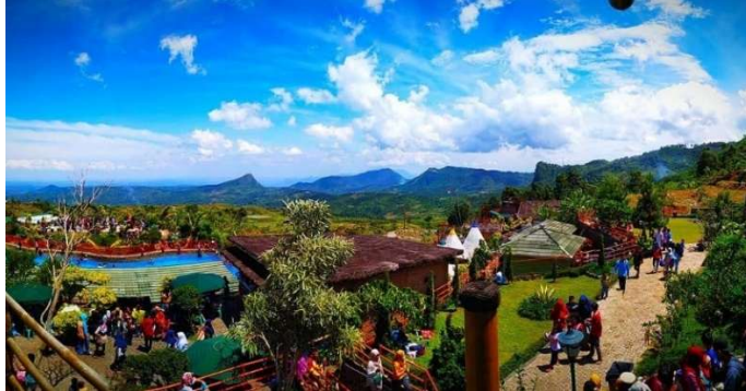
Gambar 6 Kawasan Wisata Villa Khayangan

Pemandangannya yang indah dan udaranya yang sejuk membuat Anda merasa lebih baik dan lebih rileks. Salah satu tipe penginapan Villa Khayangan Bogor yang menarik adalah Tenda Gunung Batu. Wisata Alam Villa Khayangan Bogor memiliki pemandangan pegunungan hijau yang sangat menarik untuk dikunjungi. Pemandangan hijau tidak hanya ada pada bukit yang hijau saja, tetapi berada pada spot-spot fotonya juga.