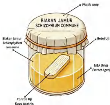
Gambar 2. Ilustrasi Pengujian Sampel Kayu Terhadap Jamur Schizophyllum commune

Berdasarkan SNI 01-7207-2014, ketahanan kayu terhadap jamur diklasifikasikan ke dalam lima kelas berdasarkan persentase penurunan bobot, sebagaimana ditunjukkan pada Tabel 1.