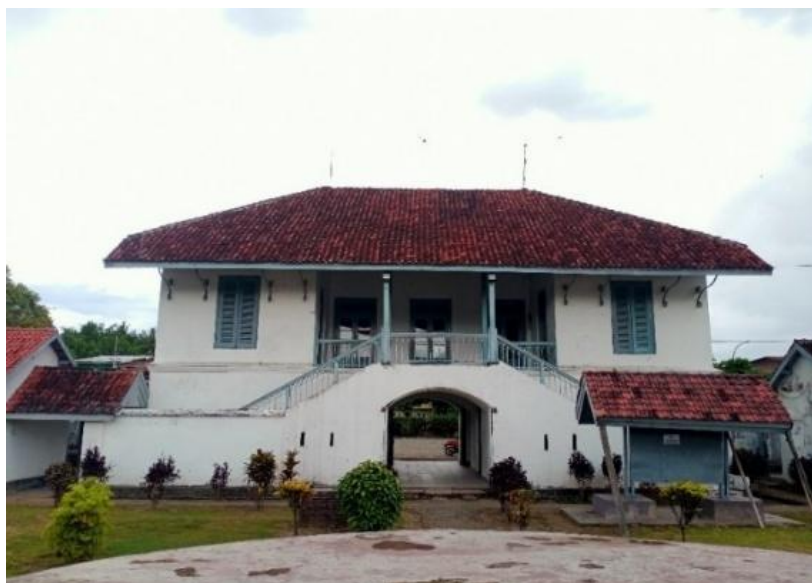
Gambar 1. Museum Balangnipa

Selain itu, Museum Balangnipa juga berada dalam kompleks Benteng Balangnipa yang memiliki nilai historis tinggi, khususnya dalam sejarah kolonial dan dinamika sosial-politik masyarakat Sinjai. Kondisi tersebut menjadikan Museum Balangnipa sebagai objek yang relevan untuk diteliti dalam konteks penguatan identitas daerah.