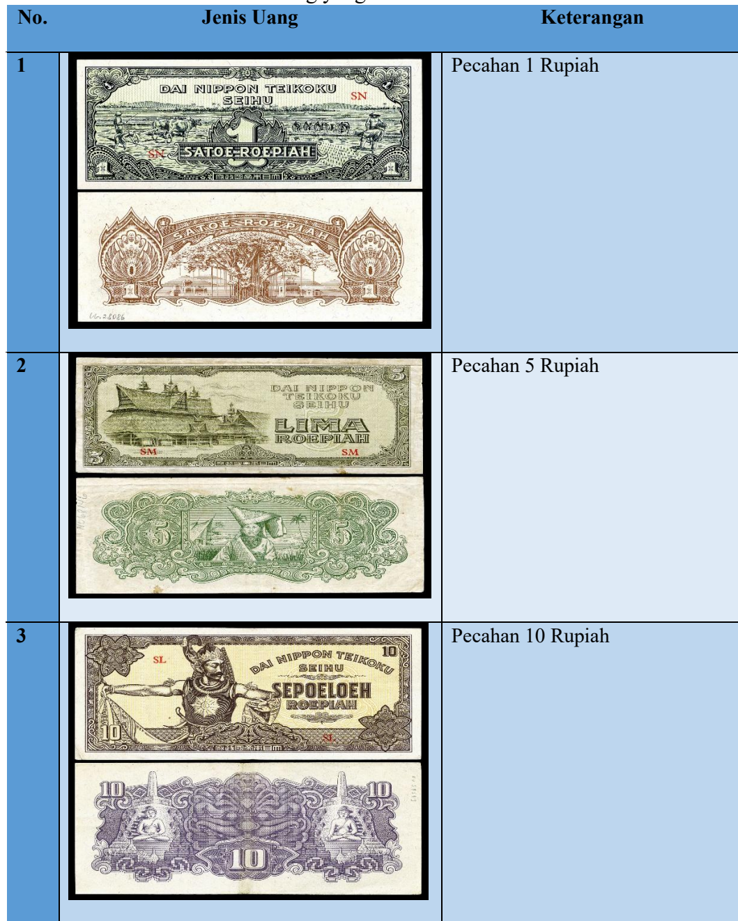
Tabel 2 Jenis uang yang didistribusi NKG