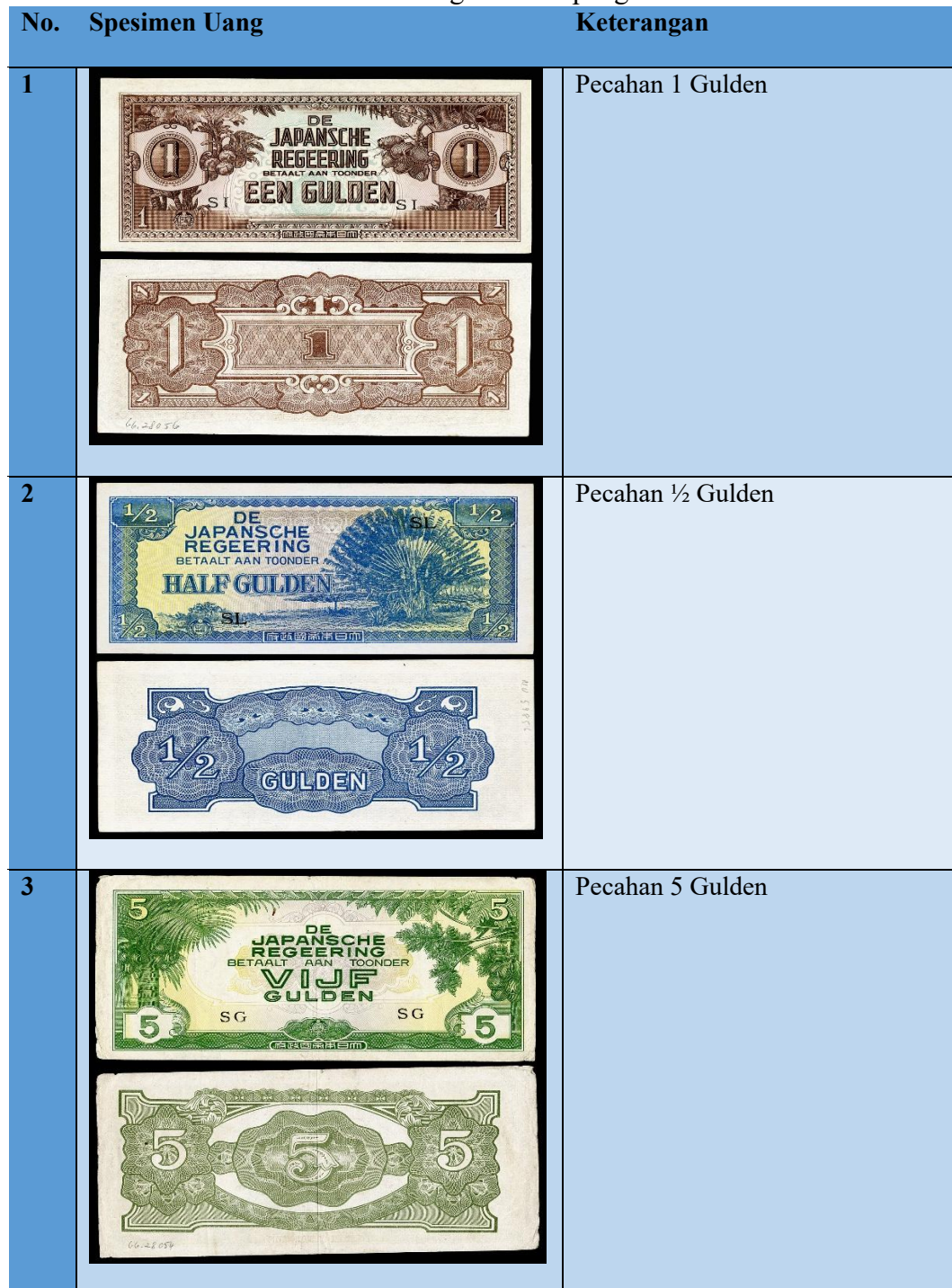
Tabel 1 Jenis Uang Invasi Jepang