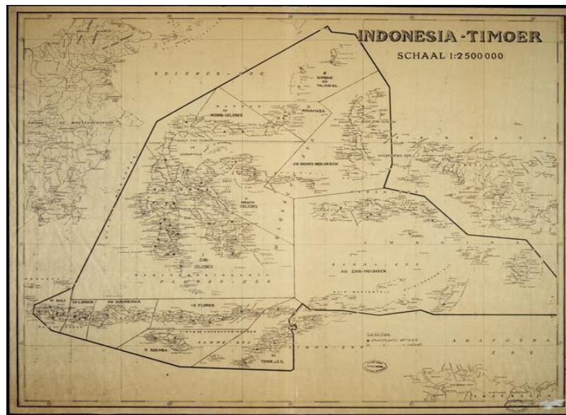
Gambar 2: Peta Negara Indonesia Timur