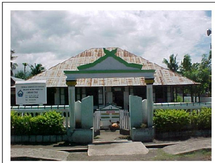
Gambar.2.6. Sekolah Belanda di Bonthain , (Sumber: Widya Nayati, Social Dynamics and Local Trading Pattern in the Bonthain Region, South Sulawesi (Indonesia), 2005)

Watampone, Palopo, Parepare, dan Bonthain . Kelebihan sekolah ini adalah adanya pemberian bahasa Belanda, bahkan bahasa asing itu menjadi pengantar, terutama pada kelas-kelas lanjutan. HIS Bonthain menampung siswa-siswa yang berasal dari Sinjai dan Selayar. 87