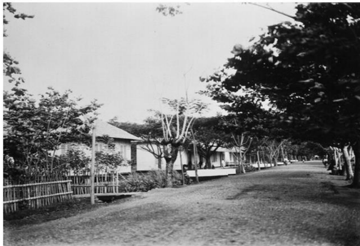
Gambar 2.3. Kantor Asisten Residen Bonthain 1900-1930

Masuknya pengaruh kolonial membawa perubahan pada sistem pemerintahan. Terjadi pergeseran dari sistem kakaraengang menjadi sistem pemerintahan kolonial. Setiap pejabat yang ada dan menduduki jabatan dalam dewan adat diberi penugasan sesuai kebutuhan pemerintahan kolonial. Peran Belanda dalam pemerintahan lebih nyata terlihat dalam pemerintahan dengan menjadikan kerajaan Bonthain sebagai Onderafdeeling pada tahun 1906. Meskipun perubahan terjadi, karaeng atau raja tetap diakui oleh Belanda sebagai kepala pemerintahan di wilayahnya dan diberi gelar Regent Van Bonthain . Ia diakui