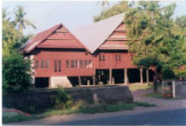
Gambar. 2.2. Balla Lompoa, (Sumber: Widya Nayati, Social Dynamics and Local Trading Pattern in the Bonthain Region, South Sulawesi (Indonesia) , 2005)