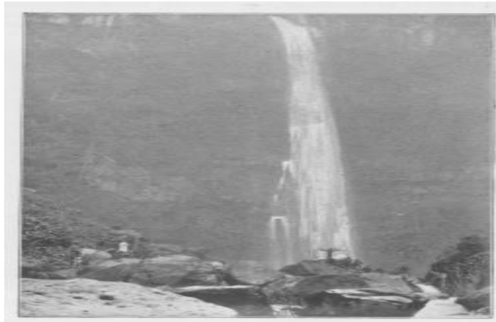
Gambar 2.5. Air Terjun Bisappu 1905

Salah satu air terjun yang bisa ditemui di Bonthain yaitu air terjun Bisappu dengan ketinggian 80 M. Namun perjalanan untuk sampai pada kaki air terjun harus melewati dasar sungai dan pendakian yang lumayan melelahkan. Disana, terdapat bebatuan yang besar serta dikelilingi oleh pohon-pohon besar yang rindang.