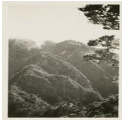
Gambar 2.4. Gunung Lompobattang,

Onderafdeeling Bonthain terletak di kaki pegunungan dengan pantai yang terhampar sepanjang jalan. Di tepi pantai terdapat deretan rumah-rumah dari batu, bambu atau kayu, beberapa diantaranya berlantai dua. Di daerah pedalaman terdapat berbagai kampung. 54 Suasana Bonthain pada 1905 di dataran rendah, terdapat perkampungan yang padat. Rumah-rumah masyarakat di dataran rendah sebagian besar dikelilingi oleh pagar tanaman. Sedangkan di daerah yang lebih tinggi, rumah-rumah masyarakat lebih tersebar dan pekarangan rumah dipisahkan oleh tembok-tembok tinggi setinggi 1 Meter yang terdiri dari batu-batu yang ditumpuk secara longgar. 55