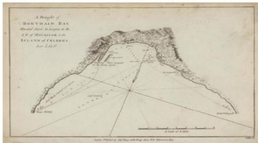
Peta. 2.1. Peta Bonthain Abad 18

pertahanannya lemah, salah satunya Bonthain . Dengan melumpuhkan Bonthain berarti melumpuhkan sumber kehidupan kerajaan Gowa. 31