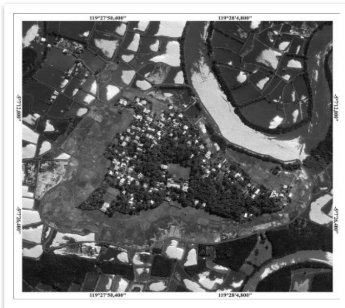
Gambar 2 peta kelurahan lakkang

Penelitian ini akan dilakukan pada bulan november sampai desember 2025 yang bertempat di kelurahan lakkang, kecamatan tallo, kota makassar, provinsi sulawesi selatan. Penentuan lokasi penelitian dilakukan secara sengaja ( purposive sampling ) dengan beberapa pertimbangan yang dimana kawasan tersebut merupakan salah satu daerah pulau wisata yang memiliki potensi sumber daya alam dan objek wisata sejarah & budaya yang ditetapkan kawasan wisata berlandaskan pada peraturan daerah (perda) kota makassar nomor 4 tahun 2015 tentang rencana tata ruang wilayah (rtrw) kota makassar tahun 2015 - 2030 tentang rencana pola ruang kota makassar. Yang dimana potensi sumberdaya alamnya terancam limbah rumah tangga yang dikeluhkan warga sejak lama. Maka dari itu penelitian memungkinkan untuk melakukan studi mengenai analisis persepsi dan tingkat partisipasi masyarakat terhadap pengolahan limbah rumah tangga di kelurahan lakkang.