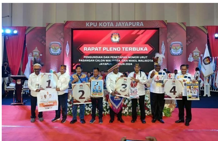
Gambar 1.1 Pasangan Calon Walikota Jayapura 2024

Perkembangan etnik Bugis di Kota Jayapura tidak hanya terbatas pada ranah sosial dan ekonomi, tetapi juga mengalami perluasan hingga ke ranah politik. Sebagai kelompok pendatang yang telah terintegrasi dengan masyarakat setempat, etnik Bugis memiliki preferensi politik yang terbentuk dari pengalaman sosial, kepentingan ekonomi, serta relasi dengan aktor politik lokal. Hal ini dapat dilihat dari keterlibatan masyarakat Bugis dalam aktivitas politik lokal, baik sebagai pemilih maupun sebagai aktor politik yang terlibat dalam kontestasi electoral dan lembaga perwakilan daerah. Kehadiran figure-figur yang berindikasi etnik Bugis dalam kontestasi Pilkada serta representasi di DPRD menunjukkan bahwa etnik Bugis memiliki visibilitas dan peran tertentu dalam dinamika politik lokal Kota Jayapura.