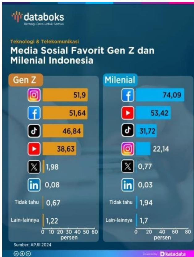
Foto/Data 1 Tren Penggunaan Sosial Media Berdasarkan Segmentasi Usia

menghadirkan citra "gemoy", memanfaatkan trend joget tik-tok dengan menciptakan gaya kampanye menggunakan lagu "oke gas" yang disertai dengan gerakan joget-jogetnya, hingga narasi "anti antek antek asing" yang senantiasa digaungkan sebagai upaya dalam menyampaikan bahwa Prabowo-Gibran merupakan pasangan yang merepresentasikan rakyat kecil dan dekat dengan Gen-Z hingga milenial. Menurut data dari KPU RI Tahun 2024 mengenai persentase pemilih dalam Pemilu 2024, menguraikan bahwa total pemilih Gen-Z dan Milenial sebanyak 113,6 Juta pemilih atau 55% dari total DPT. Yang kemudian penulis berusaha melakukan sinkronisasi terhadap intensitas dan tingkat penggunaan sosial media berdasarkan generasi di Indonesia, berdasarkan data dari Databoks menguraikan bahwa sebanyak 81% masyarakat Indonesia aktif menggunakan sosial media yang diantaranya merupakan Gen-Z sebanyak 61% aktif menggunakan sosial media selama 2-4 jam per-harinya. Yang kemudian pembagian penggunaan platform media sosial berdasarkan umur adalah Generasi Milenial sebanyak 74,9% menggunakan platform facebook, dan Gen-Z sebanyak 51,9% menggunakan platform Instagram, dan Tik-Tok.