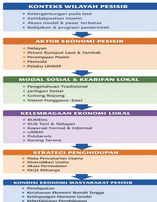
Gambar 2.1 Integrasi Pemikiran

Interaksi antara konteks pesisir, aktor ekonomi, modal sosial, dan kelembagaan lokal tersebut pada akhirnya membentuk kondisi ekonomi masyarakat pesisir Desa Mallasoro, yang tercermin dalam tingkat pendapatan, stabilitas ekonomi rumah tangga, ketahanan ekonomi, ketimpangan gender, serta keberlanjutan penghidupan masyarakat. Oleh karena itu, penelitian ini diarahkan untuk memahami secara mendalam bagaimana dinamika sosial, ekonomi, dan kelembagaan lokal membentuk kondisi ekonomi masyarakat pesisir Desa Mallasoro dalam praktik kehidupan sehari-hari.