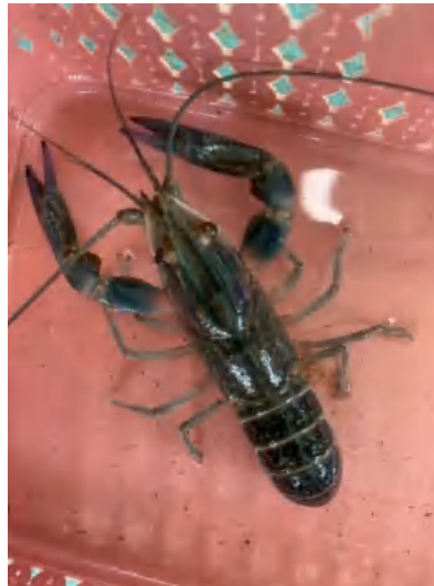
Gambar 1. Lobster air tawar ( C. quadricarinatus ) Sumber : Dokumentasi pribadi (2025).

Secara morfologi, tubuh udang terbagi menjadi dua segmen utama yakni sefalotoraks (gabungan kepala dan dada) dan abdomen (perut atau badan) (Gambar 1). Sebagai anggota krustasea, Cherax dicirikan oleh adanya kerangka luar (eksoskeleton) dan ketiadaan kerangka dalam. Bagian sefalotoraks terdiri atas beberapa anggota badan, yaitu sepasang antena, sepasang antenula, sepasang maksila, mandibula, maksilipedia, dan empat pasang kaki jalan ( pereiopod ). Sementara itu, bagian abdomen memiliki enam pasang kaki renang ( pleopod ), dua pasang ekor samping ( uropod ), dan satu telson (Kurniasih, 2008). Sefalotoraks dilindungi oleh lapisan tebal yang disebut karapas, yang tersusun dari zat tanduk atau kitin. Zat tanduk ini adalah polisakarida nitrogen, secara kimia ditulis sebagai (C_8H_{13}O_5N)_x yang dikeluarkan oleh epidermis dan dapat mengalami pengelupasan (molting) secara berkala. Karapas ini berfungsi vital untuk melindungi organ internal penting, seperti insang, sistem pencernaan (termasuk hepatopankreas), jantung, dan organ reproduksi (Kurniasih, 2008).