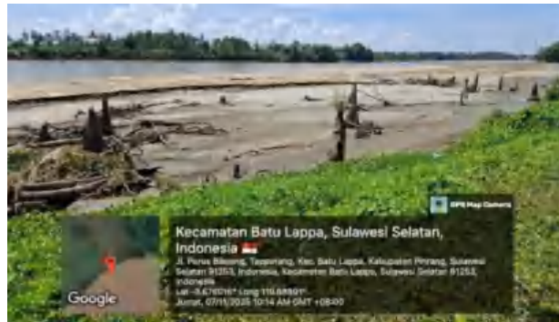
Gambar 3. Lokasi penelitian di Stasiun 2 Sungai Sa'dang, Kab. Pinrang, Sulawesi Selatan.