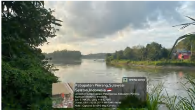
Gambar 5. Lokasi penelitian di Stasiun 4 Sungai Sa'dang, Kab. Pinrang, Sulawesi Selatan.