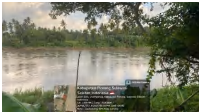
Gambar 4. Lokasi penelitian di Stasiun 3 Sungai Sa'dang, Kab. Pinrang, Sulawesi Selatan.