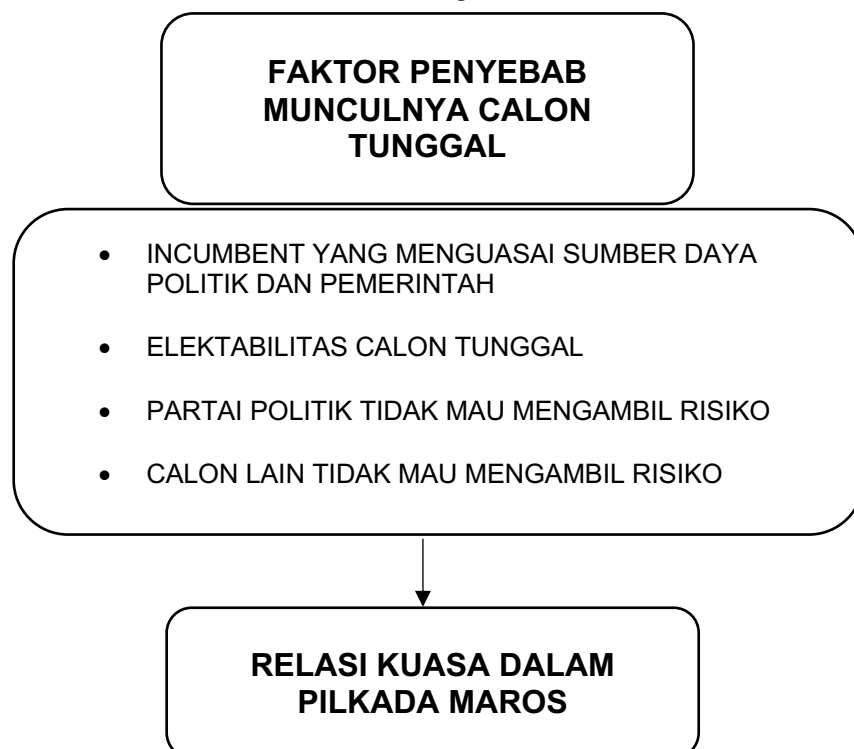
Gambar 1. Kerangka Pikir Penelitian

munculnya lawan politik. Teori ini menjelaskan mengapa figur alternatif sulit tumbuh dan bagaimana dominasi politik dipelihara melalui mekanisme informal. Di sisi lain, teori demokrasi elektoral (Dahl, 1971; Putnam, 1993) menjadi dasar untuk menilai dampak calon tunggal terhadap kualitas demokrasi, terutama dalam dimensi kompetisi, partisipasi, dan representasi. Demokrasi yang sehat seharusnya menyediakan ruang bagi kontestasi gagasan, keterlibatan masyarakat, dan keberagaman pilihan politik. Ketika tidak ada pesaing yang sah, dan masyarakat hanya dihadapkan pada satu calon, maka proses demokrasi kehilangan makna deliberatifnya. Oleh karena itu, kerangka konsep ini berupaya mengintegrasikan perspektif teoritik tersebut dalam menjelaskan hubungan antar-variabel yang akan dianalisis dalam penelitian ini.