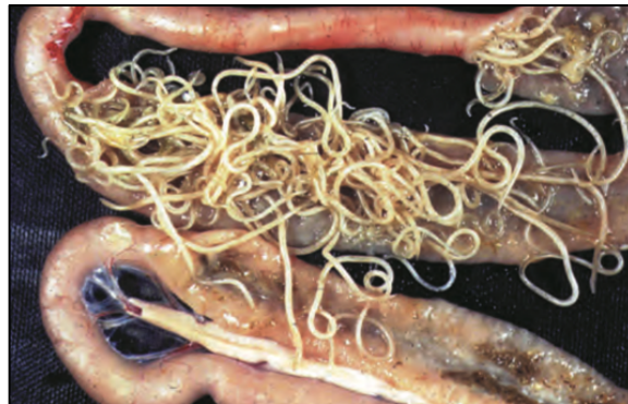
Gambar 1. Cacing A. galli pada usus ayam (Otranto dan Wall, 2024).

Ascaridia galli awalnya ditemukan di Jerman. Setelah itu, di beberapa negara juga dilaporkan ditemukan pada ayam. A. galli kini dikenal sebagai parasit unggas di seluruh dunia dengan laporan dari beberapa negara yang mencakup iklim sedang, subtropis, dan tropis. A. galli dapat ditemukan pada beberapa jenis unggas termasuk ayam, kalkun, dan beberapa burung, tetapi ayam sebagai inang utama infeksi A. galli (Singh et al., 2023). Cacing A. galli adalah spesies yang paling umum dan patogen menyebabkan penyakit yang disebut dengan askaridiasis (Quraishi et al., 2020).