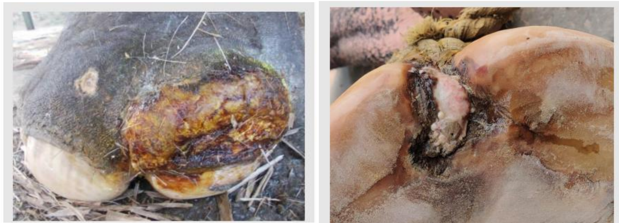
Gambar 3. Gejala Klinis Pododermatitis (Nigam et al. , 2025).

Seiring berjalannya waktu, lesi dapat berkembang menjadi lebih dalam dan luas, ditandai dengan terbentuknya luka terbuka, penebalan jaringan kuku, hemoragi lokal, serta keluarnya eksudat serosa hingga purulen. Pada tahap ini, infeksi sekunder oleh bakteri oportunistik sering terjadi dan memperparah proses inflamasi. Bau tidak sedap dari telapak kaki sering menjadi indikator adanya infeksi kronis (Eisenberg et al. , 2017). Secara klinis, gajah yang mengalami pododermatitis menunjukkan perubahan perilaku yang khas, seperti enggan berjalan jauh, pincang, sering mengistirahatkan salah satu kaki, serta penurunan aktivitas. Dalam kasus yang lebih berat, nyeri yang signifikan dapat menyebabkan gangguan locomotor dan menurunkan kualitas hidup gajah secara keseluruhan. Apabila tidak ditangani dengan baik, pododermatitis dapat berkembang menjadi abses dalam, pembentukan sinus, hingga keterlibatan jaringan tulang (osteomielitis), yang berpotensi mengancam keselamatan hewan (Rahman et al. , 2021).