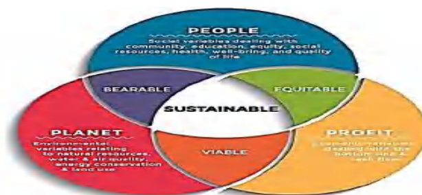
Gambar 2.1 Konsep Sustainability

kualitas kehidupan manusia masa kini hingga masa yang akan datang. Berikut gambar konsep sustainability serta penjelasannya sebagai berikut :