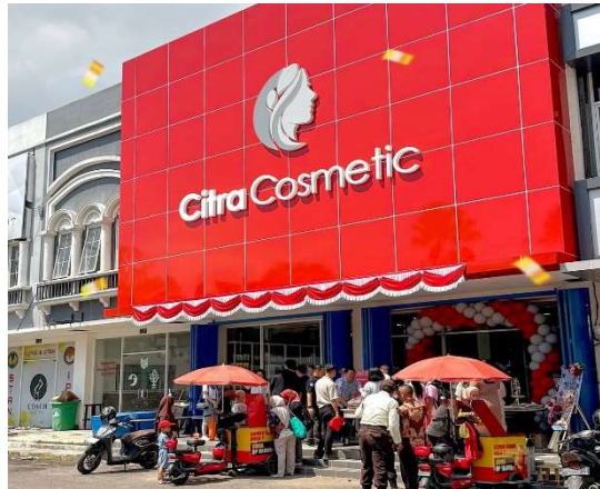
Gambar 5. Toko skincare dan Kosmetik di Makassar

Saat ini, pasar skincare juga diramaikan oleh hadirnya toko multi-brand skincare di Makassar seperti Citra Kosmetik, Omorfo Shop, Buno Shop, dan masih banyak lagi. Toko ini hadir dengan menyediakan berbagai jenis produk yang dikurasi sesuai tren, serta menerapkan strategi pemasaran melalui kolaborasi dengan influencer lokal. Kehadirannya berhasil menarik konsumen dari berbagai kalangan. Bahkan toko-toko multi brand ini sangat digemari masyarakat khususnya remaja atau generasi z.