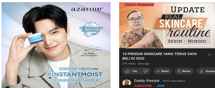
Gambar 1. Laki-Laki Brand Ambassador Skincare dan review skincare .

Menurut Handojo (2023) dalam tulisannya yang berjudul Perkembangan Industri Kecantikan, melalui para influencer atau public figure khususnya laki-laki yang menjadi brand ambassador suatu klinik kecantikan dan skincare telah memperkenalkan produk kepada calon konsumen dan menggiring agar tertarik dengan produk yang direkomendasikan serta concern akan pentingnya merawat diri terutama kulit. Selain itu, dapat pula dilihat pada platform youtube yang menampilkan video edukasi maupun review mengenai perawatan wajah yang tidak hanya dilakukan oleh perempuan saja, melainkan juga oleh laki-laki. Hal tersebut mengurangi stereotip bahwa perawatan wajah hanya untuk perempuan saja dan dapat memberikan ruang bagi laki-laki untuk mengekspresikan identitas diri mereka.