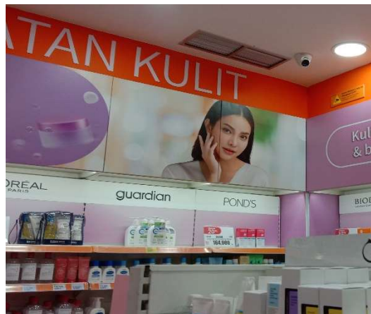
Gambar 4. Store Guardian

Toko besar tersebut biasanya hadir dalam bentuk gerai resmi ( official store ) dari brand ternama maupun toko multibrand yang menyediakan berbagai pilihan produk dalam satu tempat. Beberapa di antaranya membuka cabang di pusat perbelanjaan modern yang menjadi destinasi utama belanja masyarakat urban dengan konsep modern dan pelayanan yang lebih profesional, toko-toko ini berhasil membangun kepercayaan konsumen, terutama terkait keaslian produk dan jaminan kualitas. Seiring meningkatnya kesadaran akan pentingnya perawatan wajah, mulailah bermunculan jaringan ritel nasional seperti Guardian, Watsons, dan Sociolla Store.