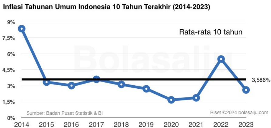
Gambar 1 Inflasi Indonesia Tahun 2014-2023

Berita resmi statistik BPS pada Januari 2025 menyatakan bahwa Indeks Harga Konsumen (IKH) Desember 2024 berada pada 1,57% YoY ( year-on-year ). Badan riset Bolasalju mencatat angka inflasi dalam 10 tahun terakhir cenderung menurun dan terkendali yang mencerminkan efektivitas kebijakan moneter dan koordinasi antara pemerintah pusat dan pemerintah daerah dalam menjaga stabilitas harga.