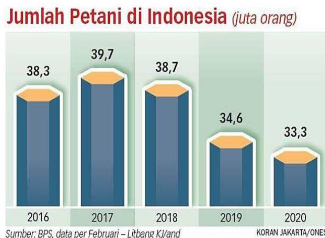
Gambar 2. Jumlah Petani Indonesia