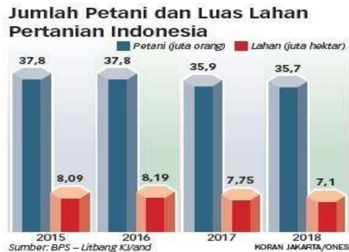
Gambar 3. Jumlah Petani dan Luas Pertanian Indonesia

Sumber Data: Badan Pusat Statistik (BPS) tahun 2021