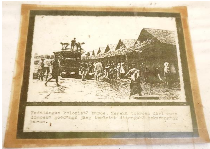
Foto 8: Kedatangan kolonis-kolonis baru di gudang-gudang yang terletak di tengah pekarangan baru (tahun tidak diketahui)

ternyata tidak seberat angkatan pertama. Hal ini disebabkan oleh fakta bahwa mereka sudah bisa memperoleh bahan makanan dasar dari para kolonis yang datang lebih dulu. Artinya, tidak semua kesulitan awal harus mereka alami dari nol seperti para pendahulu mereka.