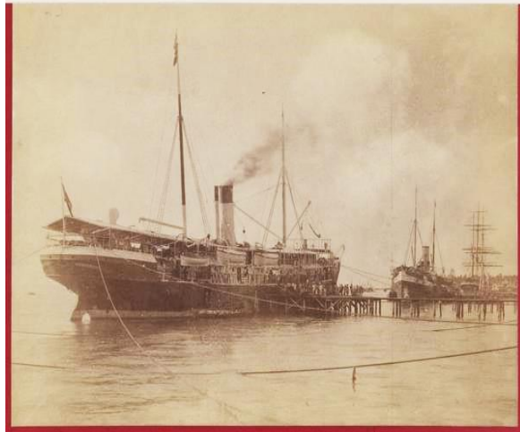
Foto 5: Dokumentasi Kapal (Koninklijke Paketvaart Maatschappij) dari Perusahaan Nederlandsche Handel-Maatschappij Yang Merupakan Angkutan bagi Para Transmigrasi di Wonomulyo