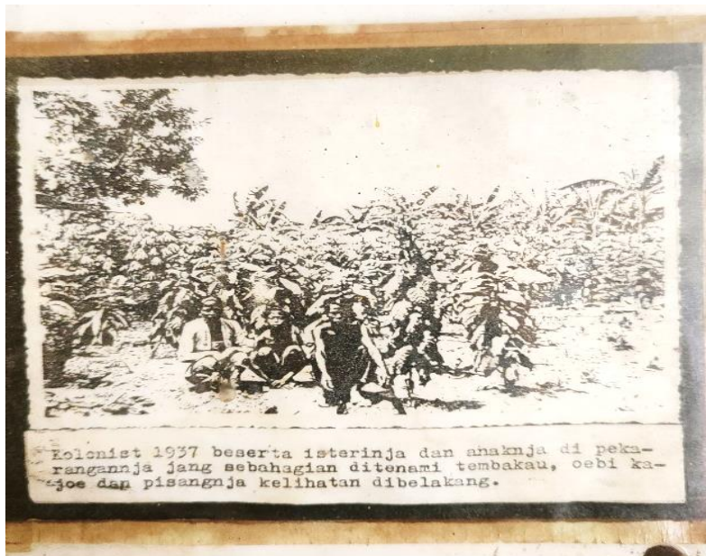
Foto 7: Kolonis tahun 1937 beserta istri dan anaknya di pekarangan yang sebagian ditanami tembakau, ubi kayu, dan pisang nampak di belakang.

membangun kehidupan dan bertani, meskipun dengan segala keterbatasan yang ada, terutama terkait luas lahan dan kondisi alam yang masih harus diolah dari awal. 61