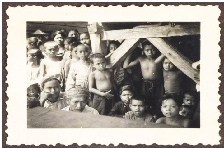
Foto 4: Dokumentasi Anak-anak Transmigrasi Jawa yang di tampung di distrik Mapilli Tahun 1940

Pemerintah kolonial kemudian menetapkan Mapilli sebagai bagian dari distrik koloni di bawah administrasi Onderafdeeling Polewali. Dengan status tersebut, Mapilli dipersiapkan secara khusus untuk menerima gelombang-gelombang penduduk dari Jawa yang ingin membangun kehidupan baru di luar pulau. Para transmigran yang dikirim ke daerah ini mayoritas berasal dari wilayah Jawa Tengah dan Jawa Timur, dan mereka dipilih melalui serangkaian proses yang cukup ketat. 50