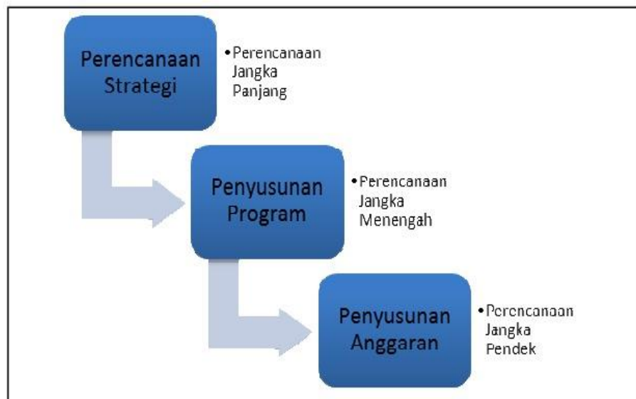
Gambar 2.1: Penyusunan Anggaran dalam Perencanaan

Sumber: Mohamad Mahsun, 2019. Penganggaran Sektor Publik. Banten, Universitas Terbuka