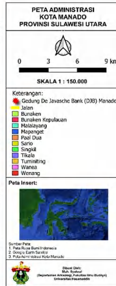
Gambar 1. Peta Administrasi Kota Manado (Digambar oleh : Muh. Syahrul, 2024)