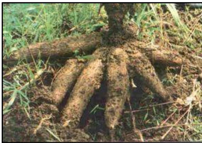
Gambar 2.1. Singkong ( manihot esculenta crantz atau manihot utilisima ) (Rahmawati, 2010)

Singkong merupakan jenis umbi-umbian yang banyak dikonsumsi masyarakat. Singkong merupakan sumber karbohidrat yang paling penting setelah beras, sesuai dengan kemajuan teknologi pengolahan singkong tidak hanya terbatas pada produksi pangan, tetapi merambah sebagai bahan baku industri pellet atau pakan ternak, tepung tapioka pembuatan alkohol, tepung gaplek, ampas tapioka yang digunakan dalam industri kue, roti, kerupuk, dan lain-lain (Said & Abram, 2016).