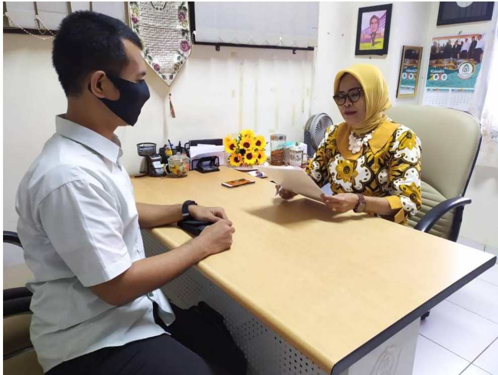
Berkoordinasi dengan Ketua Program Studi Ilmu Komunikasi Universitas Islam Negeri Alauddin Makassar untuk izin penelitian