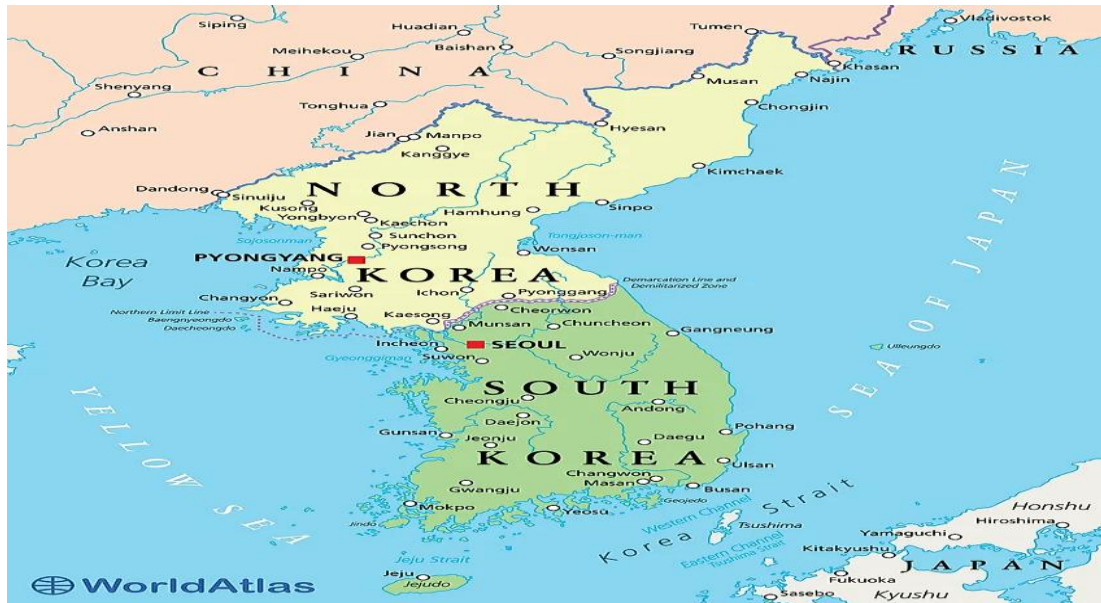
Gambar 1. Peta batas korea selatan dan korea utara

Timur dan mendorong Korea Selatan menghadapi kebutuhan mendesak untuk memperkuat sistem pertahanannya demi mengimbangi peningkatan ancaman Pyongyang.