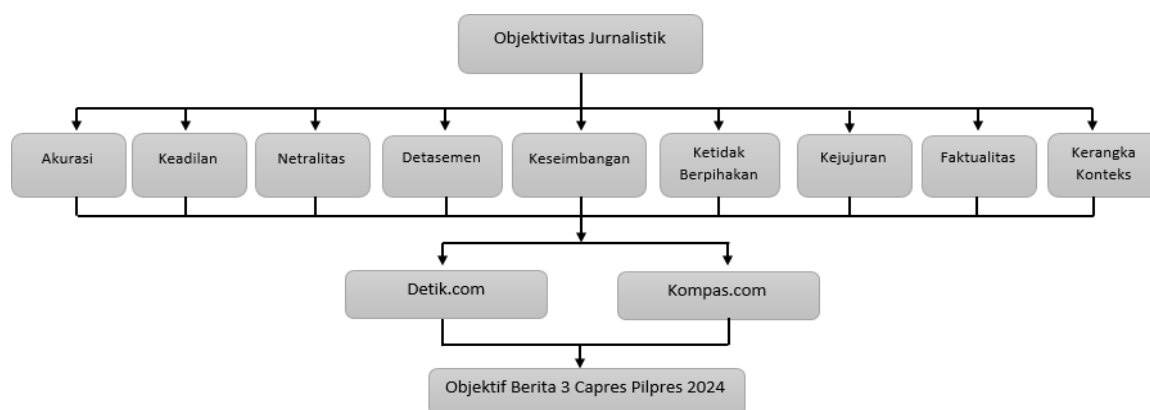
Gambar 2. 1 Kerangka Pikir