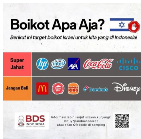
Gambar 1. Target Prioritas Boikot BSD 3 Desember 2024