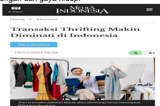
Gambar 1.1 Perkembangan Fashion Thrift Di Indonesia.

Fashion kini menjadi kebutuhan bagi setiap orang, tidak hanya wanita saja yang mengikuti fashion , namun pria pun juga mengikuti fashion . Mengikuti fashion terkadang membuat kita tidak terasa telah menghabiskan banyak uang, terlebih lagi hanya sekedar membeli barang-barang yang ingin kita beli agar terlihat styles . Saat ini tidak perlu mengeluarkan uang banyak dan harus cari barang baru untuk tetap tampil fashionable , karena zaman sekarang fashion thrift merupakan pilihan yang tepat agar membuat penampilan tetap styles dan tidak ketinggalan gaya fashion terkini. Jika membahas tentang fashion tidak akan ada ujungnya karena setiap tahun atau bulan nya akan berkembang sangat pesat, entah dari budaya, lingkungan dan gaya hidup.