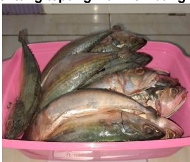
Gambar 1. 2 Ikan Kembung