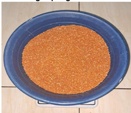
Gambar 1. 1 Biji Jawawut