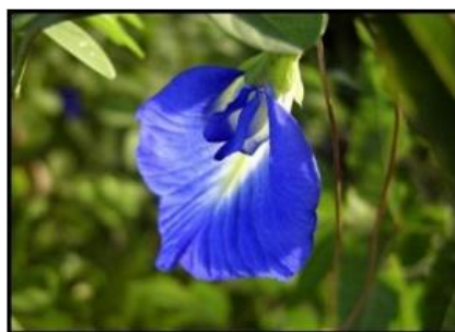
Gambar 1. Bunga Telang ( Clitoria ternatea L. )

Bunga telang ( Clitoria Terenatea L. ) adalah bunga yang mengandung tinggi antioksidan yang biasanya tumbuh di pekarangan rumah, hutan atau bahkan pinggir kebun. Antioksidan didefinisikan sebagai senyawa yang bekerja menghambat oksidasi dengan cara bereaksi dengan radikal bebas reaktif yang membentuk radikal bebas tidak reaktif yang tidak stabil. Antioksidan merupakan semua bahan yang dapat menunda atau mencegah kerusakan akibat oksidasi pada molekul sasaran. Dalam pengertian kimia antioksidan adalah senyawa-senyawa pemberi elektron, tetapi dalam pengertian biologis lebih luas lagi, yaitu semua senyawa yang dapat meredam dampak negatif oksidan, termasuk enzim-enzim dan protein-protein pengikat logam (Sumartini dkk., 2020). Berikut gambar Bunga Telang: