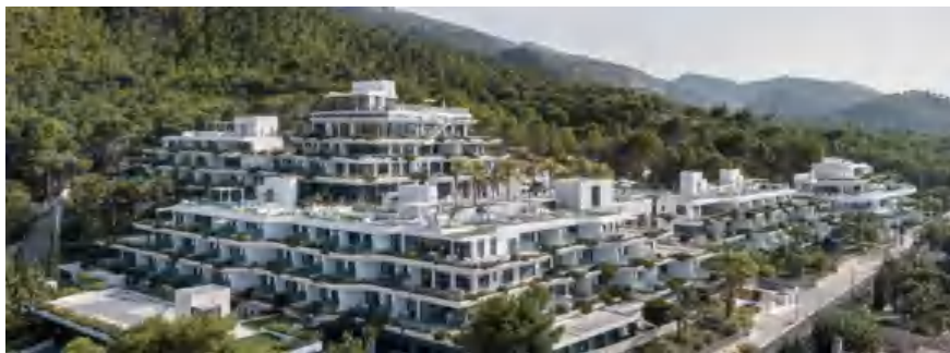
Gambar 4 SHA Wellness Clinic