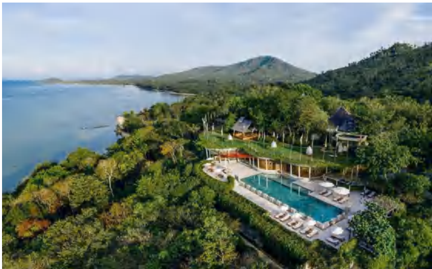
Gambar 1 Kamalaya Koh Samui