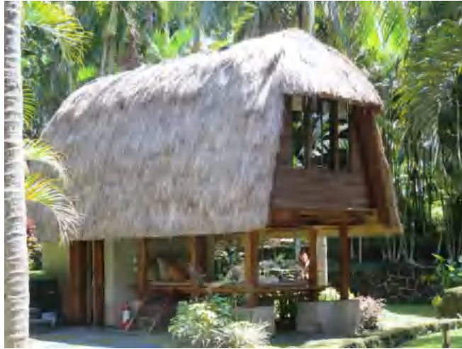
Gambar 2 The Farm