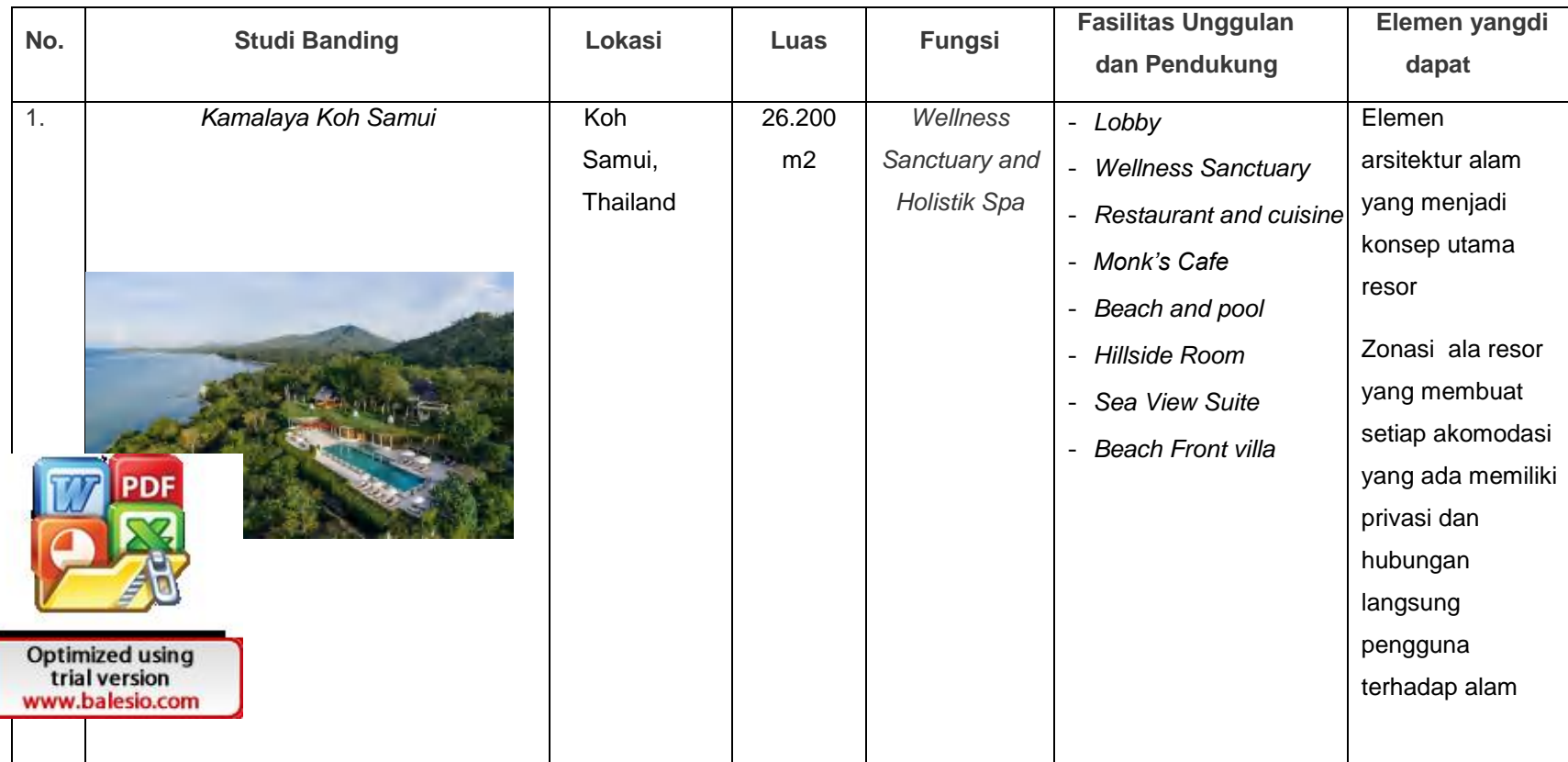
Tabel 1 Kesimpulan studi banding