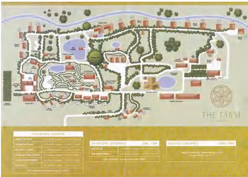
Gambar 3 Layout One Taste Holistik

s://www.thefarmatsanbenito.com diakses 2 Oktober 2022