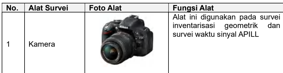
Tabel 2. Peralatan Survei