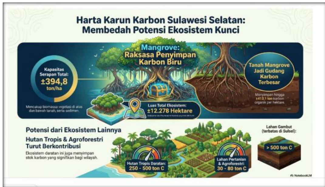
Gambar 1. Harta Karun Karbon Sulawesi Selatan membedah Potensi Ekosistem Kunci. (Sumber Literatur blue carbon global )

Dari data jenis ekosistem dan potensi karbon tersebut di atas, kami mencoba menelusuri literatur lain yang menggambarkan potensi tersebut. Sebuah gambar yang menyebut bahwa ekosistem dan potensi tersebut bagaikan sebuah harta karun ekosistem sangat relevan dengan tujuan penelitian ini.