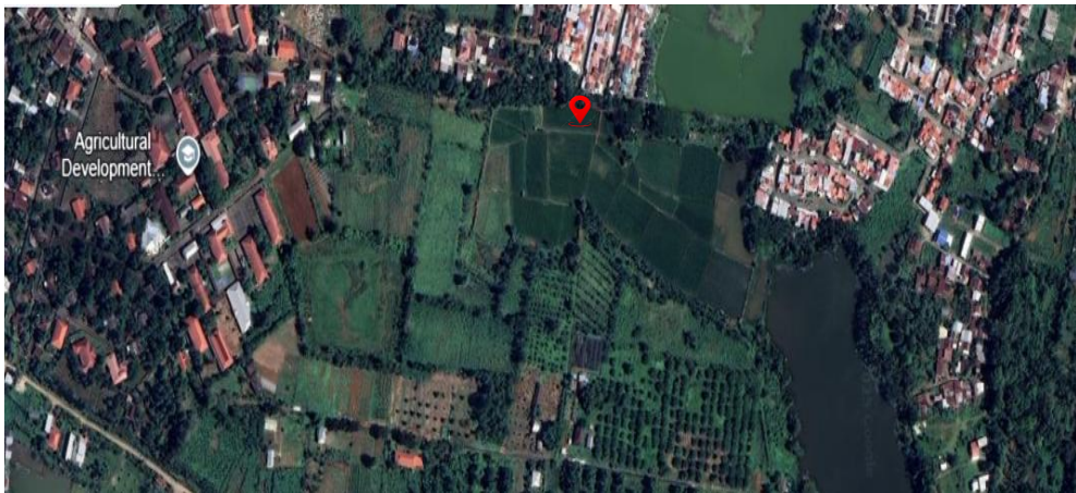
Gambar 1: Lokasi penelitian di Lahan Persawahan Politeknik Pembangunan Pertanian Gowa, Jl Malino No.KM 7. Romang Lompoa, Kecamatan Bontomarannu, Kabupaten Gowa, Sulawesi Selatan, 5°13'00"S 119°30'28" E. Elevasi 8,46 m di atas permukaan laut.

Penelitian ini dilaksanakan di Lahan Persawahan Politeknik Pembangunan Pertanian Gowa, Jl Malino No.KM 7. Romang Lompoa, Kecamatan Bontomarannu, Kabupaten Gowa, Sulawesi Selatan, Laboratorium Kimia dan Kesuburan Tanah Fakultas Pertanian Universitas Hasanuddin, Laboratorium Kimia Pakan Jurusan Nutrisi dan Makanan Ternak Fakultas Peternakan Universitas Hasanuddin, Laboratorium Produktivitas dan Kualitas Perairan (LPKP) Fakultas Ilmu Kelautan dan Perikanan Universitas Hasanuddin. Waktu penelitian dilaksanakan pada bulan Desember 2024 sampai selesai.