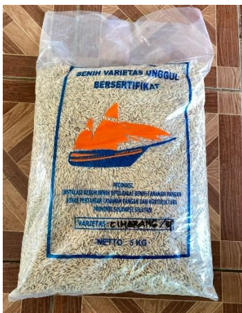
Gambar 4. Benih padi varietas ciherang