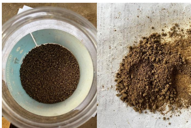
Gambar 5. Pakan buatan organik