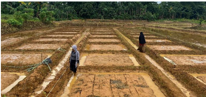
Gambar 2. Petakan perlakuan