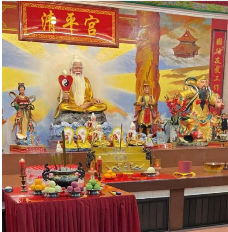
Gambar 1.8.34 Persembahan di altar utama Maha Dewa Tao dan altar Dewa-Dewi