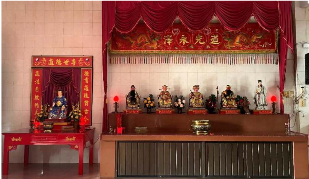
Gambar 1.8.2. Altar Dewa Dao De Shi Zun (道德世尊 Dàodé Shìzūn) dan Altar Dewa-Dewi Tao di lantai dua Taokwan Qing Ping Gong

Taokwan Qing Ping Gong juga rutin melaksanakan upacara sembahyang Dewa-Dewi Tao, sembahyang pada tanggal 1 dan 15 berdasarkan penanggalan Imlek, pelaksanaan Imlek, Po Un (保运仪式 Bǎo yùn yíshì), pelaksanaan kumpul-kumpul umat, sharing dan diskusi. Pada minggu pagi dilaksanakan ekstra bina anak, remaja, dan kumpul muda-mudi. Selain itu, Taokwan Sinar Damai juga rutin melaksanakan bakti sosial ke masyarakat umum menyambut Perayaan Hari Kebesaran Dewa-Dewi, mengunjungi panti asuhan dan panti jompo menyambut Hari Kemerdekaan Indonesia. Tidak hanya di masyarakat umum, umat Tao juga rutin melakukan pembagian bingkisan-bingkisan dalam rangka menyambut Imlek di lingkup internal umat yang tidak mampu hingga bantuan biaya pendidikan.