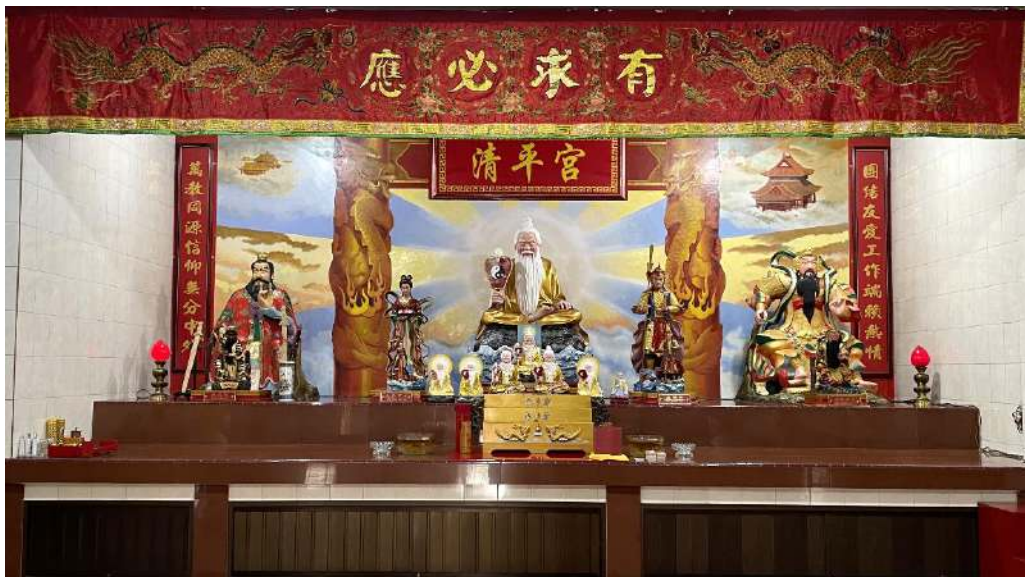
Gambar 1.8.2 Altar utama Dewa-Dewi Tao (神仙 Shénxiān) di lantai dua Taokwan Qing Ping Gong

Sedangkan di lantai kedua, terdapat tempat ibadah khusus umat Tao. Terdapat altar utama Dewa-Dewi Tao (神仙 Shénxiān) yang dipuja, di posisi tengah terdapat Maha Dewa Tai Shang Lao Jun (太上老君 Tàishàng Lǎojūn), di sebelah kanan-Nya ada Dewi Jiu Tian Xuan Nü (九天玄女 Jiǔtiān Xuánnǚ) dan Xuan Tian Shang Di (玄天上帝 Xuántiān Shàngdì), di sebelah kiri-Nya ada Dewa Er Lang Shen (二郎神 Èrlángshén) dan Zhang Dao Ling Tian Shi (张道陵天师 Zhāng Dào Líng Tiānshī).