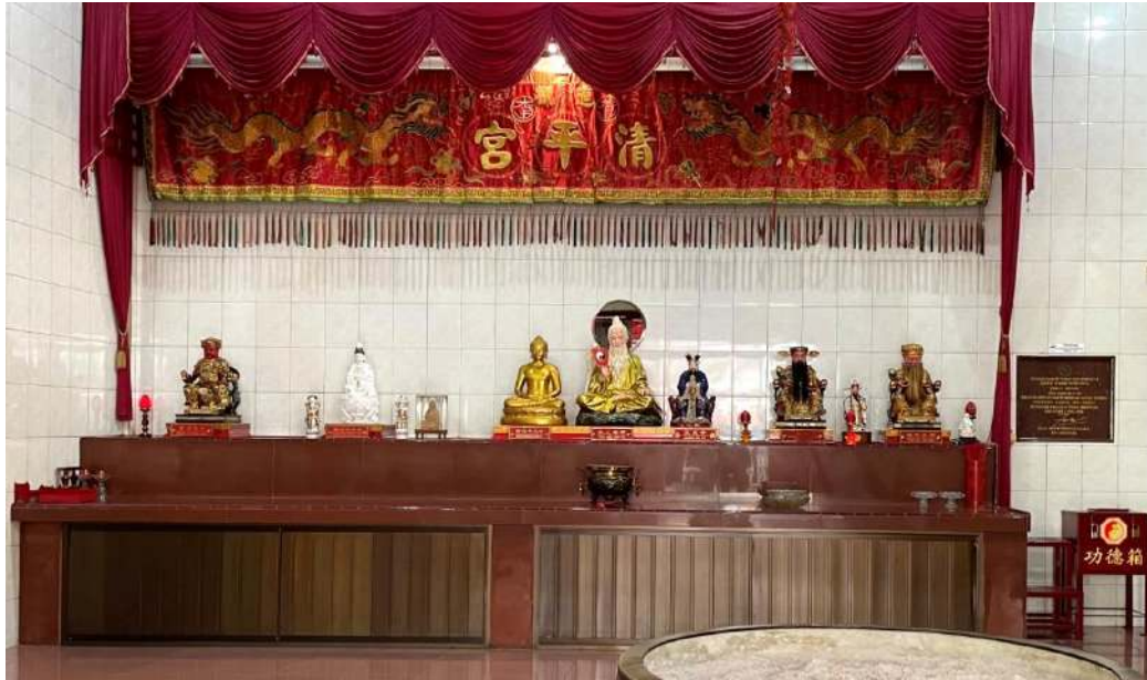
Gambar 1.8.2 Altar Tridharma di lantai dasar Taokwan Qing Ping Gong

Sedangkan di lantai kedua, terdapat tempat ibadah khusus umat Tao. Terdapat altar utama Dewa-Dewi Tao (神仙 Shénxiān) yang dipuja, di posisi tengah terdapat Maha Dewa Tai Shang Lao Jun (太上老君 Tàishàng Lǎojūn), di sebelah kanan-Nya ada Dewi Jiu Tian Xuan Nü (九天玄女 Jiǔtiān Xuánnǚ) dan Xuan Tian Shang Di (玄天上帝 Xuántiān Shàngdì), di sebelah kiri-Nya ada Dewa Er Lang Shen (二郎神 Èrlángshén) dan Zhang Dao Ling Tian Shi (张道陵天师 Zhāng Dào Líng Tiānshī).