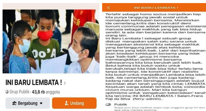
Gambar 2.

Keberadaan grup Facebook INI BARU LEMBATA! bertepatan dengan gejolak Arab Spring, bahkan lebih awal daripada fenomena pemanfaatan Facebook di Amerika dalam kampanye #MeToo Movement di Amerika Serikat.