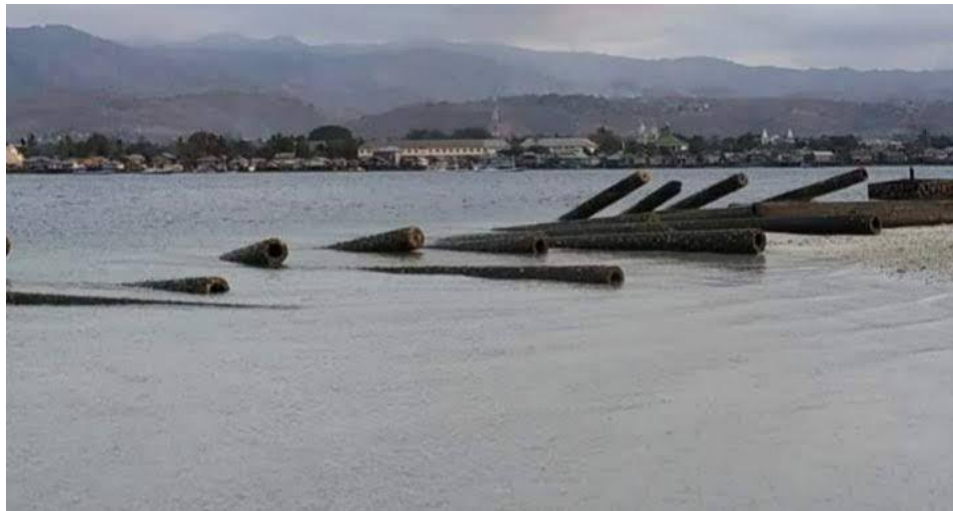
Gambar 4.

Proyek Awololong kemudian mangkrak dan menimbulkan persoalan hukum. Tim penyidik Direktorat Kriminal Khusus (Direskrimsus) Polda Nusa Tenggara Timur kemudian menetapkan tiga orang tersangka dalam kasus dugaan korupsi proyek pembangunan tiang apung, kolam renang, dan fasilitas penunjang lainnya di Pulau Siput Awololong pada 21 Desember 2020. Berdasarkan hasil penyelidikan, proyek yang ditangani oleh Dinas Pariwisata dan Kebudayaan Kabupaten Lembata pada tahun anggaran 2018/2019 tersebut telah merugikan keuangan negara sebesar Rp 1.446.891.718 atau lebih dari Rp 1 miliar dari total anggaran yang digunakan (Kompas.com, 2022).