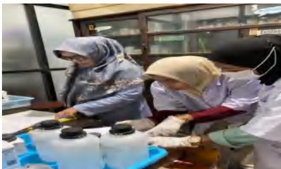
Gambar 4 Proses Pembuatan pupuk