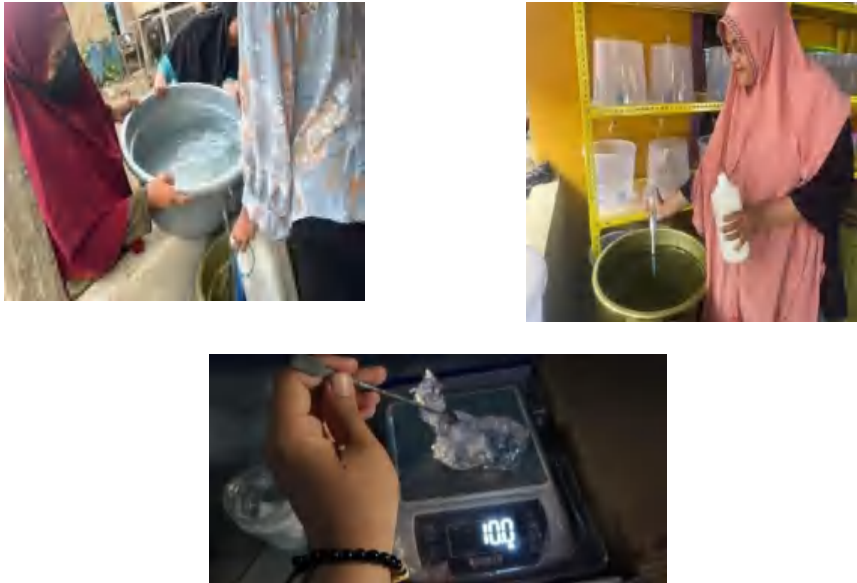
Gambar 3 Proses Penelitian