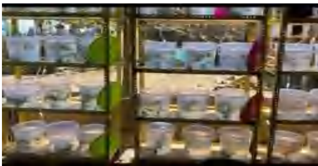
Gambar 5 Pemeliharaan Rumput laut

Wadah kultur yang digunakan adalah toples dengan dimensi diameter 25 cm x tinggi 24 cm dengan volume air 10 liter. Jumlah toples 12 buah. Lalu toples yang telah terisi air laut disusun di atas rak kultur, penyusun toples wadah di rak kultur pada (Gambar 5 ) di bawah ini :