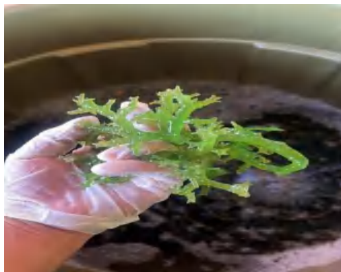
Gambar 2 . Rumput Laut

menggunakan air laut steril hingga bau iodin benar-benar hilang, Proses ini dapat dilihat pada (Gambar 2).