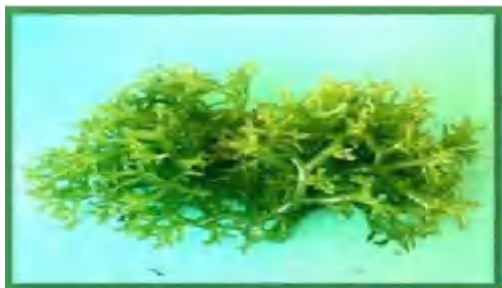
Gambar1. Kappaphycus striatum (Ali et al.,2014)

tumbuhan talus merupakan tubuhnya masih belum bisa dibedakan antara akar, batang dan daun . Seluruh bagian tubuhnya disebut talus sehingga rumput laut tergolong tumbuhan tingkat rendah (Kusuma 2024)