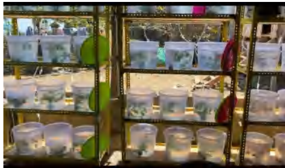
Gambar 4. Wadah Penelitian

Wadah yang digunakan dalam penelitian ini adalah toples plastik sebanyak 9 buah yang berkapasitas 12 L, setiap wadah diisi air sebanyak 10 L. Sebelum toples digunakan untuk pemeliharaan, seluruh toples dibersihkan secara higienis menggunakan air mengalir untuk menghilangkan residu dan kontaminan kemudian dikeringkan. Selanjutnya toples diisi air steril sebanyak 10 L Kemudian masing-masing toples dilengkapi aerasi untuk menyuplai oksigen. Wadah penelitian dapat disajikan pada Gambar 4.