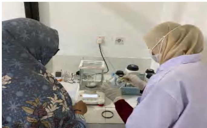
Gambar 6. Persiapan Pengayaan