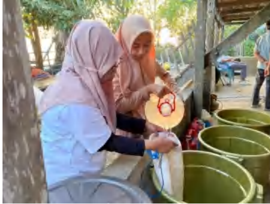
Gambar 3. Persiapan air laut steril

Penetralan sisa klorin menggunakan natrium thiosulfat sebagai zat pereduksi yang akan menghilangkan klorin bebas dan menghasilkan senyawa yang tidak beracun.