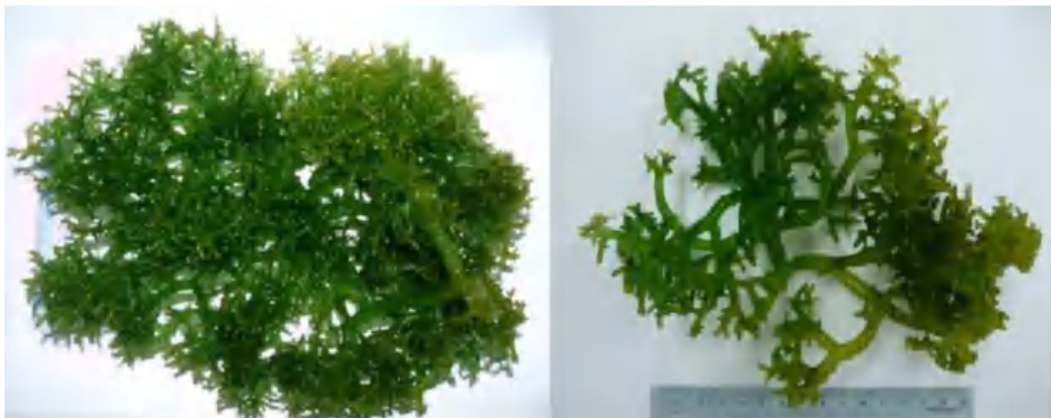
Gambar 1. Rumpun Laut Kappaphycus striatum

Kingdom : Plantae Divisi : Rhodophyta Kelas : Floridophyceae Ordo : Gigartinales Famili : Solieriaceae Genus : Kappaphycus Spesies : Kappaphycus striatum