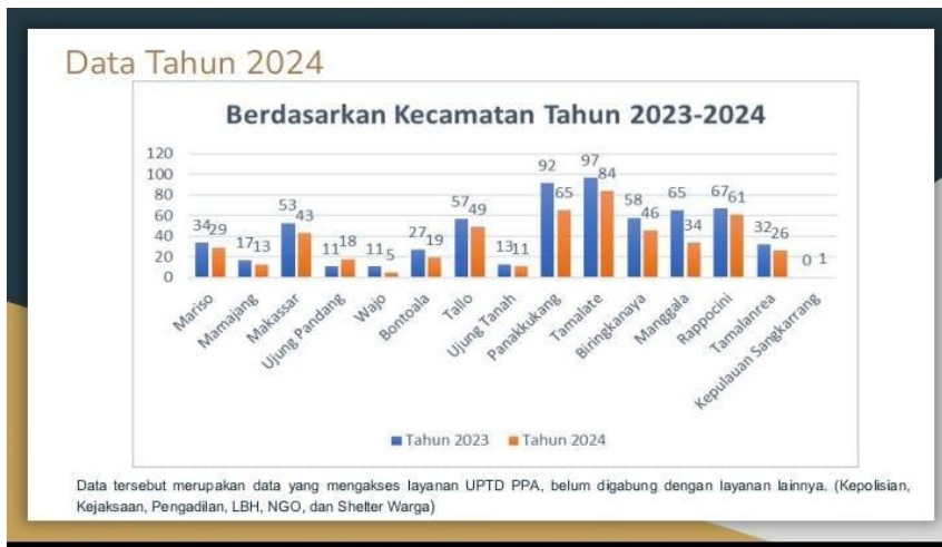
Gambar 1. 2 Grafik data kasus perkecamatan tahun 2023-2024 Sumber: UPTD PPA Kota Makassar

Berdasarkan data jumlah kasus kekerasan terhadap perempuan dan anak yang dihimpun layanan UPTD PPA Kota Makassar pada periode tahun 2023–2024, terlihat adanya variasi jumlah kasus antar kecamatan yang cukup signifikan. Data ini menunjukkan bahwa kasus kekerasan tidak tersebar secara merata, melainkan terkonsentrasi pada beberapa kecamatan tertentu. Perlu digarisbawahi bahwa data ini hanya mencakup kasus yang mengakses layanan UPTD PPA dan belum digabungkan dengan data dari institusi lain seperti kepolisian, kejaksaan, pengadilan, lembaga bantuan hukum, LSM, maupun shelter warga, sehingga angka yang ditampilkan mencerminkan capaian layanan UPTD PPA secara langsung.