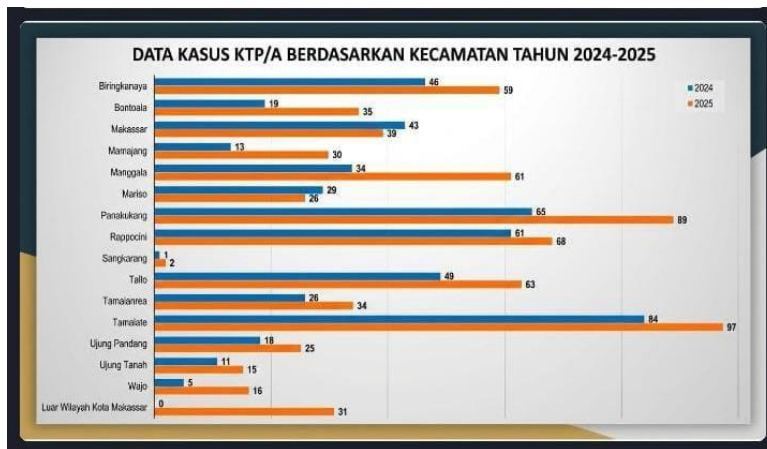
Gambar 1. 3 Data Kasus KTP/A berdasarkan kecamatan tahun 2024-2025 Sumber: UPTD PPA Kota Makassar

Kasus kekerasan terhadap perempuan dan anak (KTP/A) yang ditangani UPTD PPA Kota Makassar pada tahun 2024 dan 2025 berdasarkan kecamatan diatas, terlihat adanya peningkatan jumlah kasus di hampir seluruh wilayah kecamatan, meskipun dengan tingkat kenaikan yang berbeda-beda. Secara umum, data ini memperlihatkan bahwa persoalan kekerasan terhadap perempuan dan anak masih tersebar luas di berbagai kecamatan dan belum menunjukkan pola penurunan yang signifikan. Perbedaan jumlah kasus antar kecamatan juga menunjukkan bahwa faktor wilayah, kepadatan penduduk, dinamika sosial, serta akses terhadap layanan perlindungan sangat memengaruhi angka pelaporan kasus.