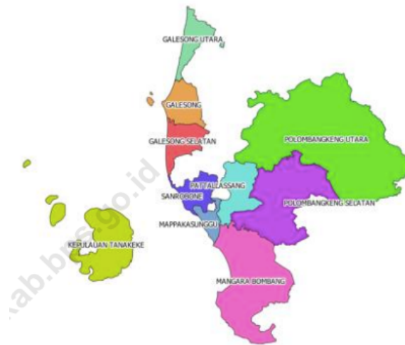
gambar 2.1 peta wilayah kabupaten takalar