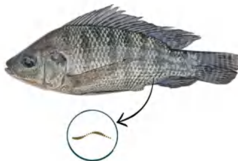
Gambar 3. Feses untuk uji Kortisol Ikan