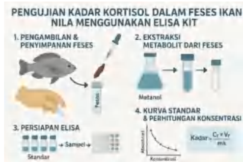
Gambar 7. Prosedur Pengujian Kadar Kortisol dalam Feses Ikan Nila

Menurut Lemos et al. (2023), Pengambilan feses sebagai bahan uji kadar kortisol pada ikan nila tergolong sebagai pengujian non invasif, yang dinilai menurunkan lonjakan stress pada ikan sebelum dilakukannya pengambilan sample pada ikan.