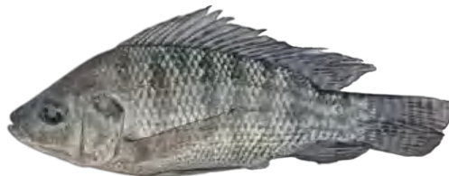
Gambar 5. Ikan Nila Sultana

Penelitian ini menggunakan ikan yang berasal dari BBI Bantimurung dengan jenis nila Sultana berjumlah 2.400 ekor dan berukuran panjang 4 \pm 1 cm dalam keadaan sehat yang kemudian di aklimatisasi selama 24 jam sebelum digunakan.