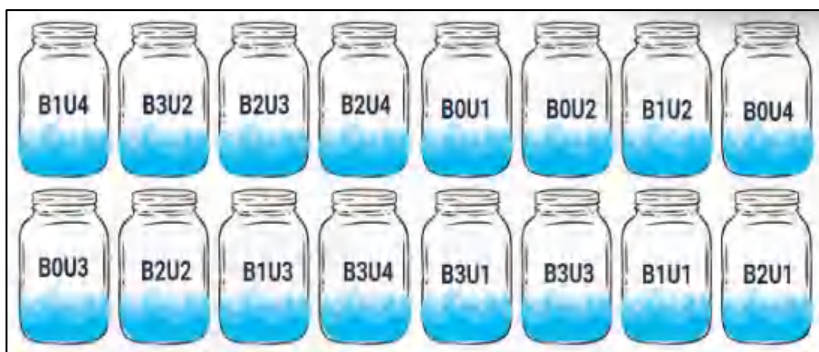
Gambar 6. Desain Wadah Penelitian