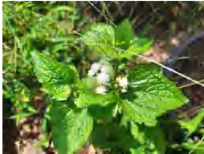
Gambar 1. Daun Bandotan

Daun bandotan merupakan bahan alami yang mengandung metabolit sekunder dari golongan aromatik (senyawa fenol) dan alkanoid (seperti flavonoid, morfin, treonin, dan saponin). Zat-zat ini berfungsi untuk memberikan efek halusinasi serta relaksasi pada otot polos (Aini et al. 2014). Kandungan alkanoid pada daun bandotan lebih dominan dibandingkan dengan golongan aromatik (Firdaus et al. 2022).