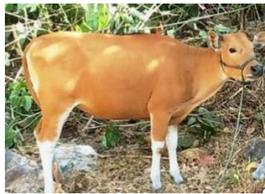
Gambar 1. Sapi Bali ( Bos sondaicus ) (Zulkharnaim et al. , 2024)

pejantan unggul, baik dari bangsa lokal maupun bangsa eksotik (Nubatonis dan Dethan, 2021). Akan tetapi, penerapan IB pada sapi Bali perlu disertai pertimbangan teknis reproduksi terutama terkait kesesuaian ukuran fetus dengan kapasitas pelvis induk. Hal ini dikarenakan pemilihan pejantan dengan ukuran tubuh dan potensi bobot lahir pedet yang terlalu besar dapat meningkatkan resiko distokia khususnya pada induk dara atau induk dengan ukuran tubuh relatif kecil (Tsaousiotti et al. , 2024)