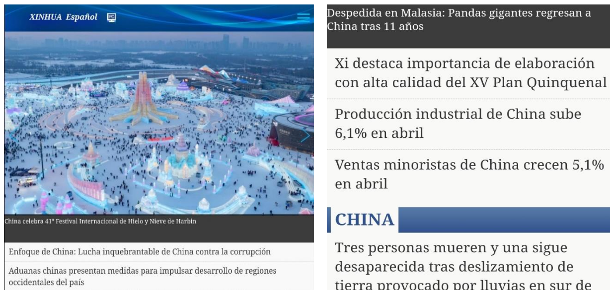
Gambar 3.3 Biro Xinhua News Agency di Spanyol