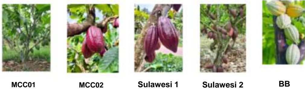
Gambar 1. Klon unggul buah kakao.